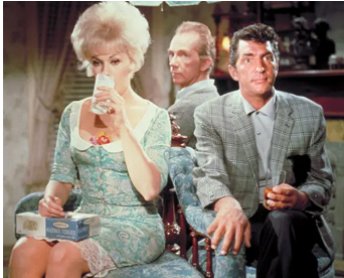
1964 EMBRASSE-MOI, IDIOT (Kiss me, stupid) de Billy Wilder avec Kim Novak, Ray Walston