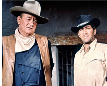
1965 LES 4 FILS DE KATIE ELDER (The Sons of Katie Elder) d'H. Hathaway avec John Wayne