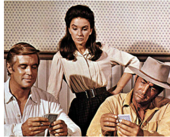
1966 VIOLENCE À JÉRICO (Rough Night in Jericho) d'A. Laven avec G. Peppard, Jean Simmons