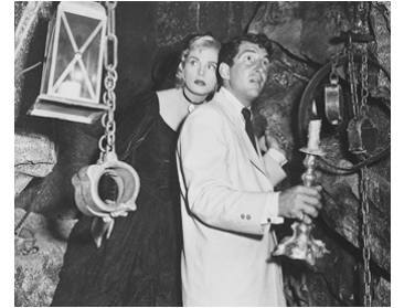
1952 FAIS-MOI PEUR (Scared Stiff) de George Marshall avec Lizbeth Scott