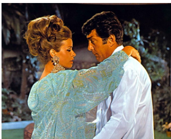
1967 MATT HELM TRAQUÉ (The Ambushers) d'Henry Levin avec Senta Berger