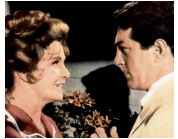
1962 LE TUMULTE (Toys in the Attic) de George Roy Hill avec Geraldine Page