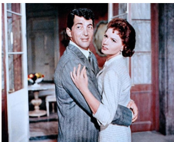
1956 10 000 CHAMBRES À COUCHER (Ten thousands Bedrooms) de Richard Thorpe avec Eva Bartok