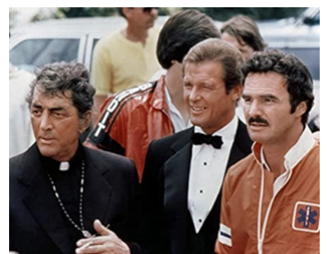
1981 L'ÉQUIPÉE DU CANNONBALL (The Cannonball Run) d'H. Needham avec R. Moore, B. Reynolds