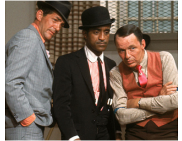
1964 LES 7 VOLEURS DE CHICAGO (Robin and the 7 Hoods) de G. Douglas avec S. Davis Jr, F. Sinatra