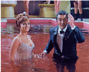
1966 BIEN JOUÉ, MATT HELM (Murderer's Now) d'Henry Levin avec Ann-Margret