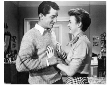
1951 BON SANG NE PEUT MENTIR (That's my Boy) d'Hal Walker avec Ruth Hussey