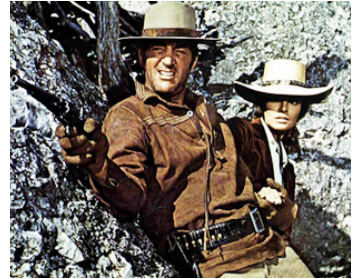
1967 BANDOLERO (Bandolero !) d'Andrew V. McLaglen avec Raquel Welch