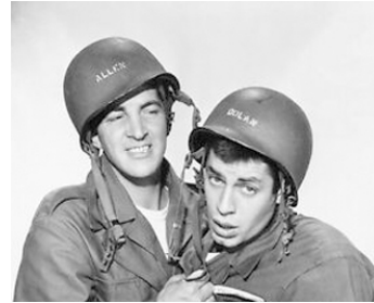
1952 PARACHUTISTE MALGRÉ LU (Jumping Jacks) de Norman Taurog avec Jerry Lewis