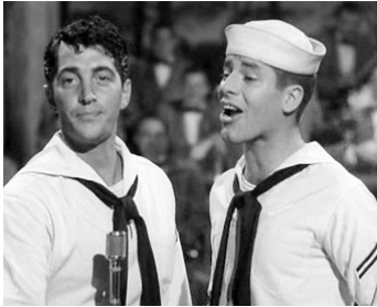
1951 LA POLKA DES MARINS (Sailor Beware!) d'Hal Walker avec Jerry Lewis