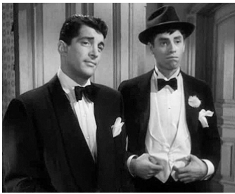
1949 MA BONNE AMIE IRMA (My Friend Irma) de George Marshall avec Jerry Lewis