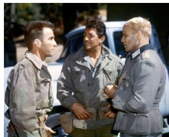
1957 LE BAL DES MAUDITS (The Young Lions) d'E. Dmytryk avec Montgomery Clift, M. Brando