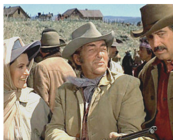
1972 DUEL DANS LA POUSSIÈRE (Showdown) de G. Seaton avec Susan Clark, Rock Hudson