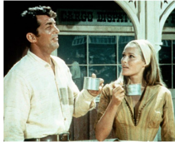
1963 QUATRE DU TEXAS (Four for Texas) de Robert Aldrich avec Ursula Andress