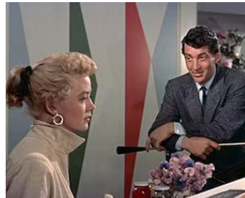
1955 ARTISTES ET MODÈLES (Artists and Models) de Frank Tashlin avec Dorothy Malone