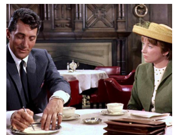
1960 IL A SUFFI D'UNE NUIT (All in a Night's Work) de Joseph Anthony avec Shirley MacLaine