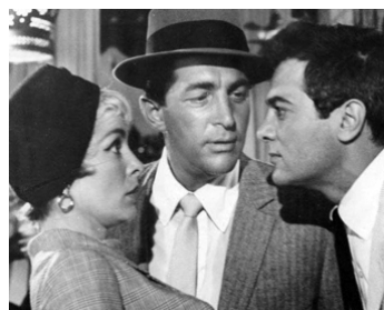
1959 QUI ÉTAIT CETTE DAME ? (Who was that Lady ?) de G. Sidney avec J. Leigh, T. Curtis