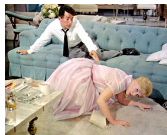
1960 UN NUMÉRO DE TONNERRE (Bells are ringing) de Vincente Minnelli avec Judy Holliday