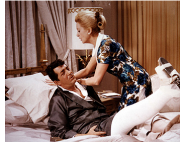
1965 LES INSÉPARABLES (Marriage on the Rocks) de Jack Donohue avec Deborah Kerr