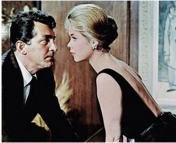
1963 MERCREDI SOIR 9 HEURES (Who's been sleeping...) de D. Mann avec E. Montgomery