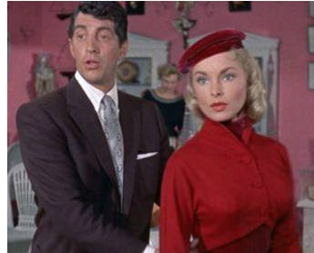
1954 C'EST PAS UNE VIE (Living it up) de Norman Taurog avec Janet Leigh