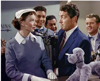
1955 UN PITRE AU PENSIONNAT (You're never too young) de Norman Taurog avec Dianna Lynn