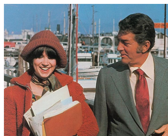
1974 MONSIEUR RICCO (Mr Ricco) de Paul Bogart avec Cindy Williams