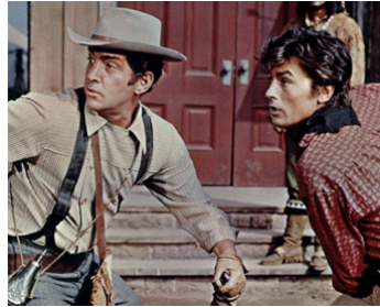
1965 TEXAS NOUS VOILÀ (Texas across the River) de Michael Gordon avec Alain Delon