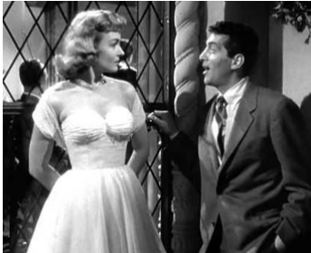
1953 AMOUR, DÉLICES ET GOLF (The Caddy) de Norman Taurog avec Donna Reed