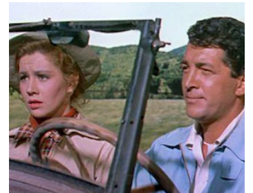
1956 UN VRAI CINGLÉ DE CINÉMA (Hollywood or bust) de Frank Tashlin avec Pat Crowley