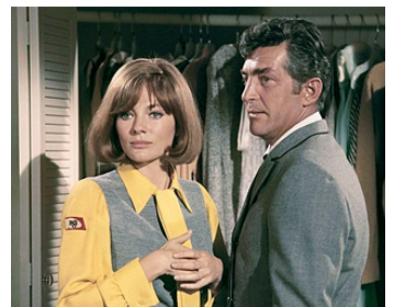
1969 AIRPORT (Airport) de George Seaton avec Jacqueline Bisset