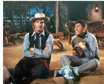
1956 LE TROUILLARD DU FAR-WEST (Partners) de Norman Taurog avec Jerry Lewis