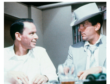
1958 COMME UN TORRENT (Some came running) de Vincente Minnelli avec Frank Sinatra