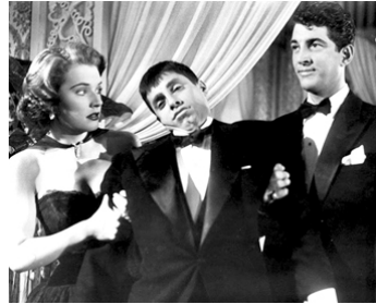
1951 LE CABOTIN ET SON COMPÈRE (The Stogie) de N. Taurog avec Marion Marshall, Jerry Lewis