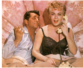
1962 L'INCONNUE DU GANG DES JEUX (Who's got the Action?) de D. Mann avec Lana Turner