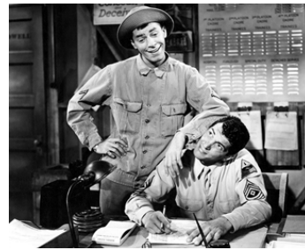
1950 LE SOLDAT RÉCALCITRANT (At War with the Army) d'Hal Walker avec Jerry Lewis