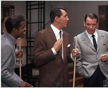
1960 L'INCONNU DE LAS VEGAS (Ocean's Eleven) de L. Milestone avec Sammy Davis Jr, Fr. Sinatra