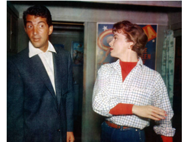
1954 LE CLOWN EST ROI (Three Ring Circus) de Joseph Pevney avec Joanne Dru