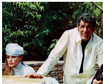
1968 MATT HELM RÈGLE SES COMPTES (The Wrecking Crew) de Ph. Karlson avec Sharon Tate