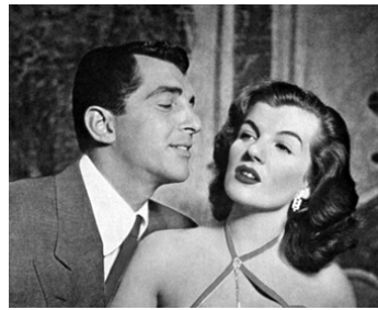
1950 IRMA À HOLLYWOOD (My Friend Irma goes West) d'Hal Walker avec Corinne Calvet