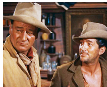
1958 RIO BRAVO (Rio Bravo) d'Howard Hawks avec John Wayne