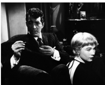
1959 EN LETTRES DE FEU (Career) de Joseph Anthony avec Shirley MacLaine