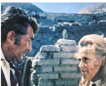
1971 RIO VERDE (Something Big) d'Andrew V. McLaglen avec Honor Blackman