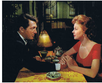
1961 LE 3 e HOMME ÉTAIT UNE FEMME (Ada) de Daniel Mann avec Susan Hayward